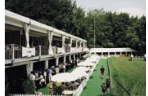
CHIO ROTTERDAM - ROTTERDAM

Naast witte zeiljachten en vele andere boten, kunt u op de jaarlijkse HISWA Te Water de witte tenten van De Boer bewonderen. In de Seaport Marina te IJmuiden worden drijvende promostands gebouwd op pontons. Op de kade bouwen wij diverse expositieruimtes en restaurants.