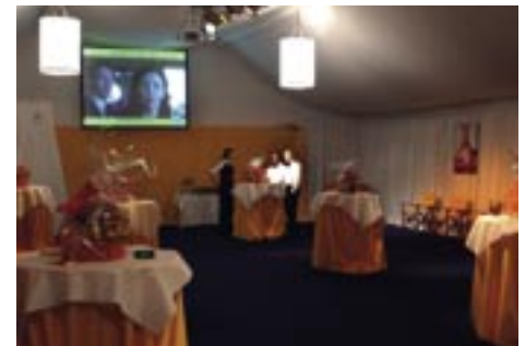
FILMFESTIVAL 2003, GENT - BELGIË

De spectaculaire Deutsche Tourwagen Masters, algemeen beschouwd als de beste toerwagenserie van Europa, komt dit jaar voor de derde maal naar Zandvoort. De krachtpatsers van Mercedes-Benz, Opel en Audi zullen het asfalt aan de Noordzeekust teisteren in fraaie duels en zinderende acties. Zeer succesvol qua publieke belangstelling maar ook qua spektakel.