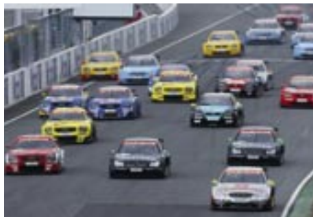
DTM ZANDVOORT - ZANDVOORT

De mooiste klassieke auto's in een koninklijke sfeer. Dat is de succesformule van dit meest prestigieuze 'Classic Cars' evenement in Nederland. Op zaterdag vindt het nationale concours plaats voor merkenclubs en op zondag het internationale concours. Daarnaast worden tientallen klassieke topmodellen rondom de thema's Alfa Romeo, Voisin en Zagato gepresenteerd.