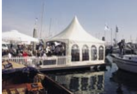
HISWA TE WATER - IJMUIDEN

De zes beste herenteams van de wereld kunt u in augustus zien strijden in het Amstelveense Wagener Stadion. Tegelijkertijd wordt door de KNHB een vierlandentoernooi georganiseerd voor dames, de Rabobank 4 Nations Cup. Als sponsor van de KNHB wordt door De Boer een gezellig promodorp gebouwd, compleet met stands, muziek en een uitstekend restaurant. Voor de sponsors wordt een hospitality accommodatie geplaatst.