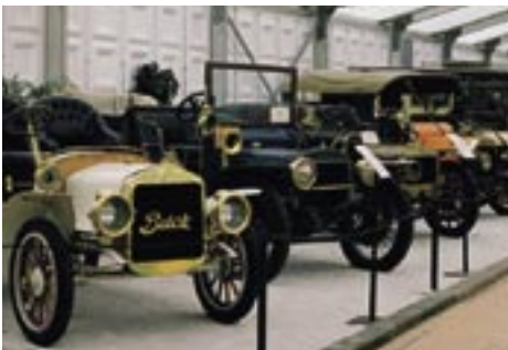
CONCOURS D'ELEGANCE, PALEIS HET LOO - APELDOORN

Elk jaar vindt in het Kralingse Bos te Rotterdam het 'Concours Hippique International Officiel' plaats. Dit internationale paardensportevenement heeft een rijke historie en wordt van oudsher gezien als één van de mooiste en gezelligste outdoor concours in Nederland. De Boer verzorgt dit jaar de hospitality accommodatie voor organisatie, hoofdsponsors en deelnemers. Daarnaast wordt ook dit jaar weer het informele Stroodorp gebouwd.