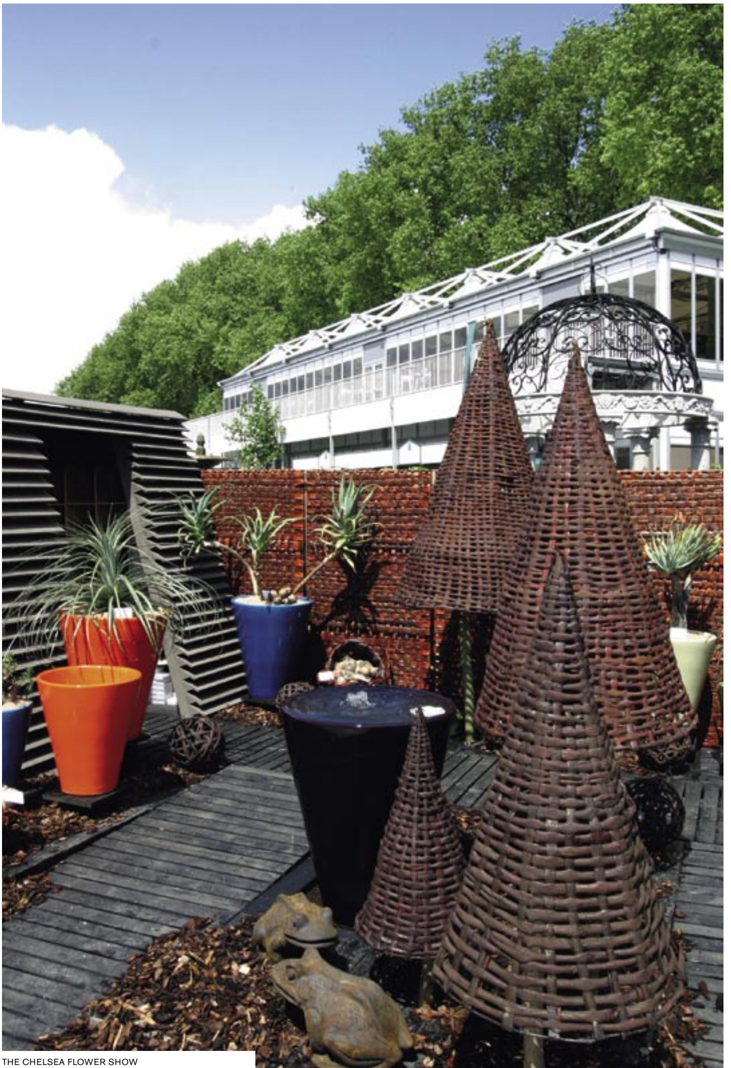
THE CHELSEA FLOWER SHOW