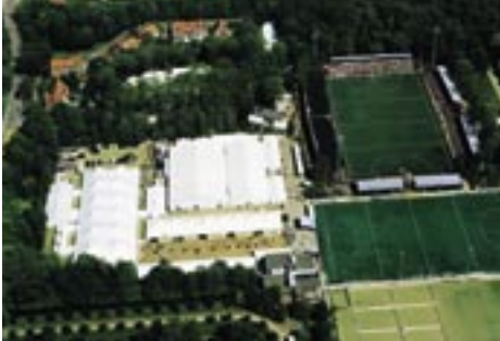
HOCKEY, CHAMPIONS TROPHY 2003, AMSTELVEEN

Ook in 2003 zijn de accommodaties van De Boer weer over de hele wereld terug te vinden. Hieronder een kleine selectie uit de Nederlandse en Belgische kalender van het najaar 2003.