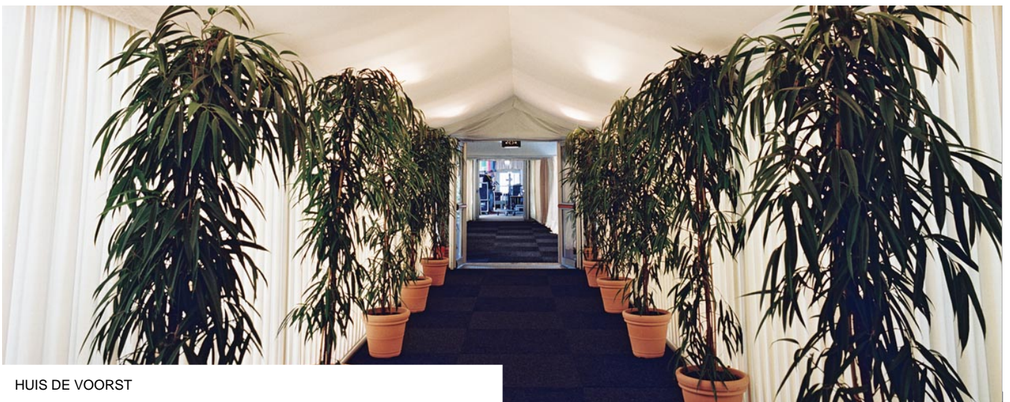
HUIS DE VOORST